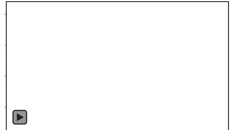
ITEM 3: Responde con balbuceos a las palabras de las personas que le hablan o a los sonidos del entorno.